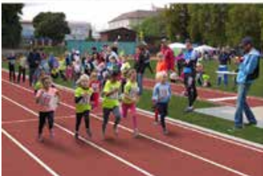
Modernizace před a po