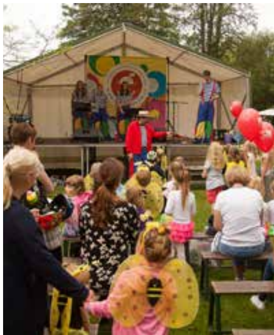
Herci z divadla Hnedle vedle to s dětmi opravdu umí.