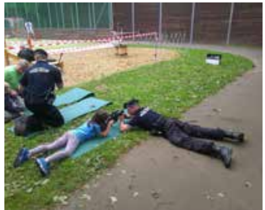
S městskou policií si letos nově mohl každý vyzkoušet střelbu ze vzduchovky.