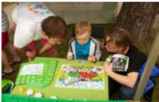
S firmou Elektrowin se od malička učíme, jak naložit s nefunkčními domácími spotřebiči.