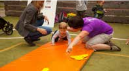
S gymnastikou je třeba začít co nejdříve.