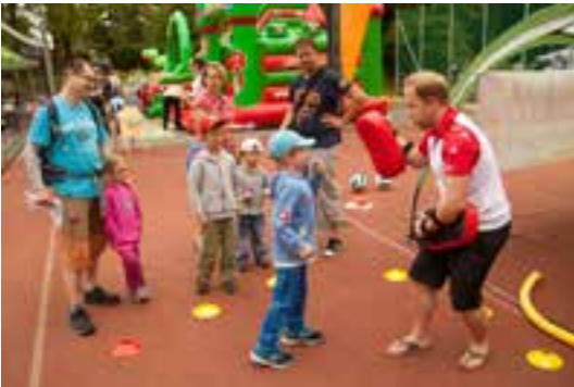
Děti si vyzkoušely karate i volejbal.

Poprvé zpestřil dětský den Celní úřad pro Středočeský kraj. Předváděl výcvik služebních psů a ukázal zabavené předměty pocházející z nelegální činnosti. K vidění byla například kůže z medvěda, želva, sloní kly nebo padělký značkových výrobků