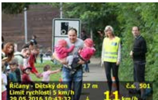
Firma Sorneco poskytla radar, a tak měli všichni borci možnost změřit si pomocí městské policie svou rychlost.