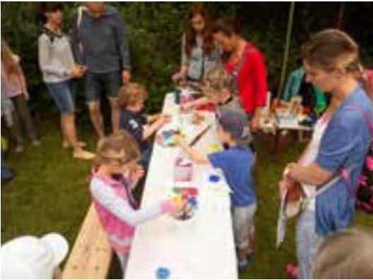
Olivova dětská léčebna připravila malování keramických pláček