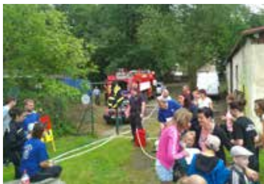
Říčanský dobrovolní hasiči jsou již tradičním lákadlem pro všechny akční děti