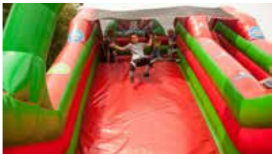
Nafukovací atrakce firmy M&M REALITY udělaly radost spoustě dětí.