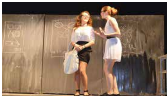
Členky dramatického kroužku a sboru