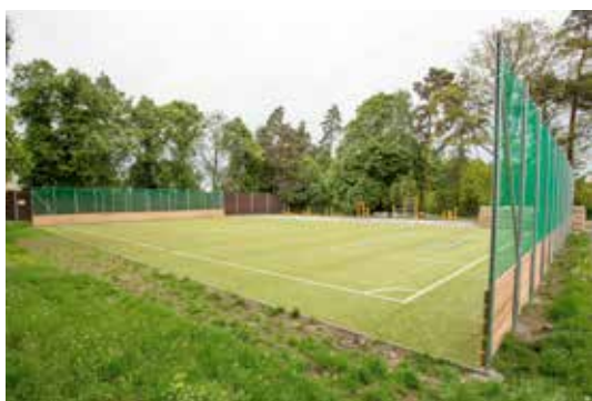
Na místě, kde se původně nacházel skatepark, vzniklo nové hřiště s umělým povrchem o ploše 42x24 metrů. Projekt modernizace areálu Strašinská zahrnoval realizaci umělé trávy a umístění prvků pro volnočasové aktivity.

V Říčanech probíhá od jara několik zásadních stavebních projektů, které jednak zlepší situaci v dopravě, školství, sociálních službách nebo sportu, ale také se významně postarají o atraktivnější tvář města.