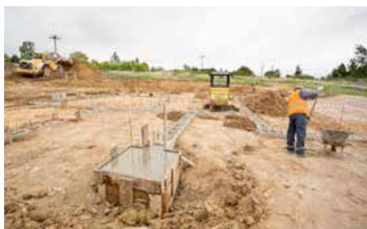
Ve svižném tempu postupují těžké stroje i v budování Mateřské školy Zahradka. Na pozemku jsou již základové desky budovy.