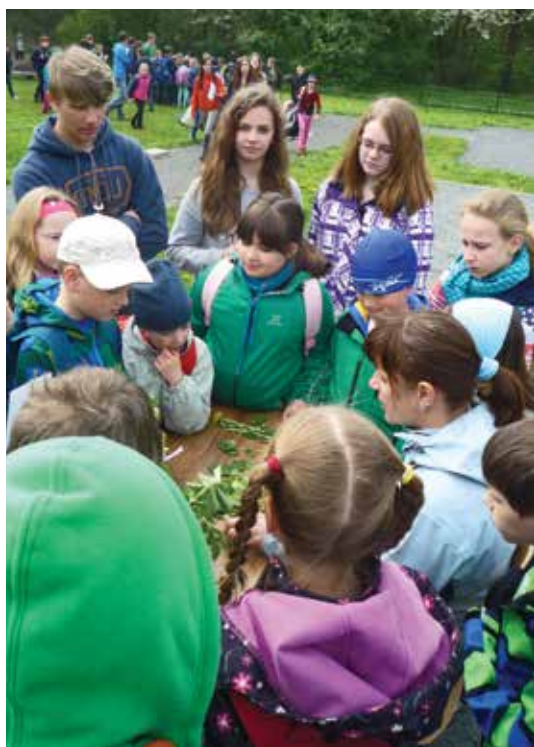
Den Země – celoškolní akce