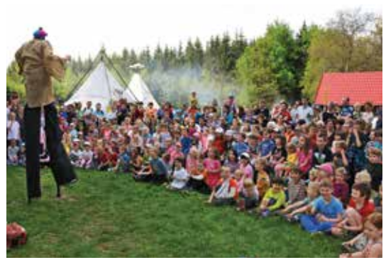
Divadlo The Hadr