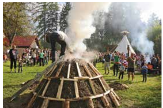
Milíř hořel pod stálou kontrolou pět dní