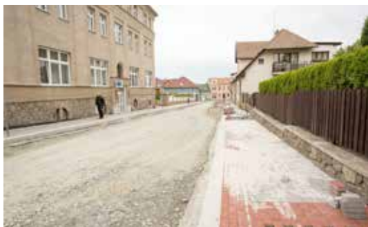
Rekonstrukční práce v ulicích Štefánikova a Rýdlova se přehoupou do své třetí etapy. Došlo k výkopům na křižovatce těchto dvou silnic a jejímu kompletnímu uzavření. Postupně se finalizuje výstavba chodníků ze zámkové dlažby ve Štefánikově ulici.