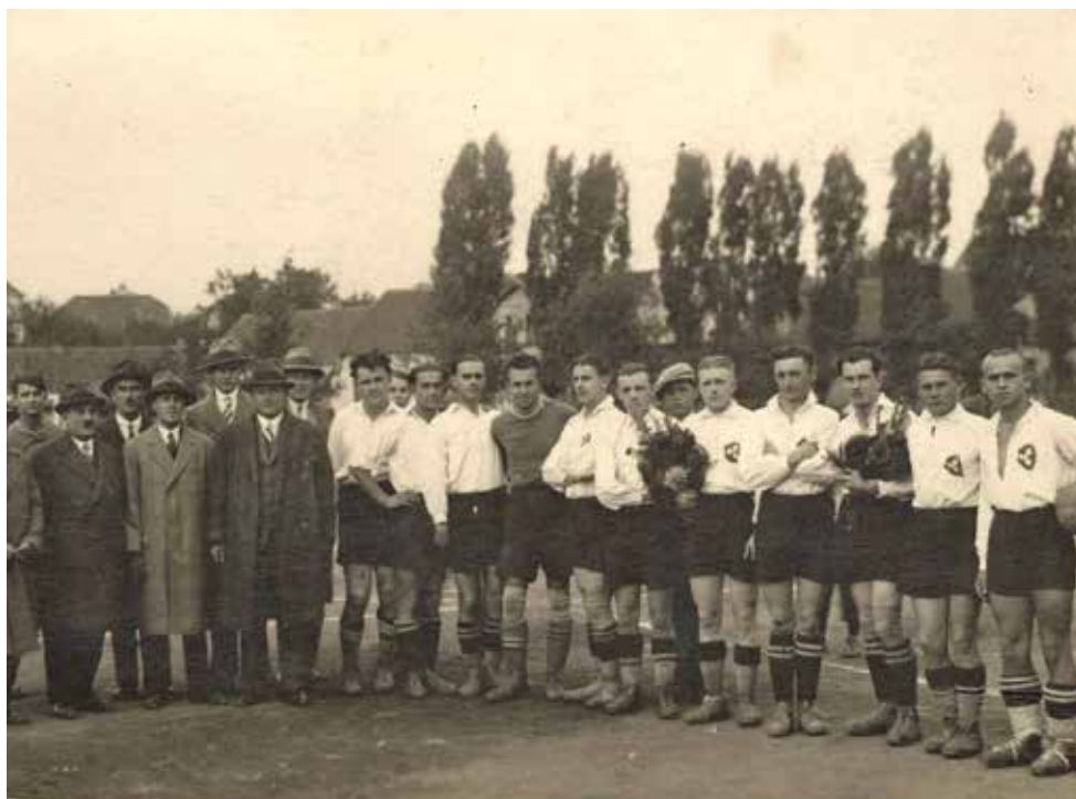
Fotbalisté a funkcionáři říčanského SK počátkem 20. let 20. století.