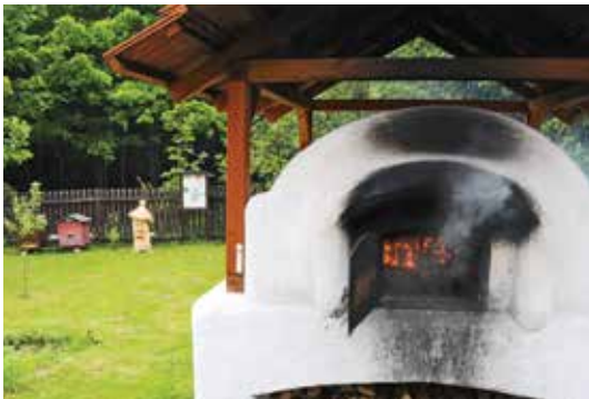
Roztápění pece na chleba