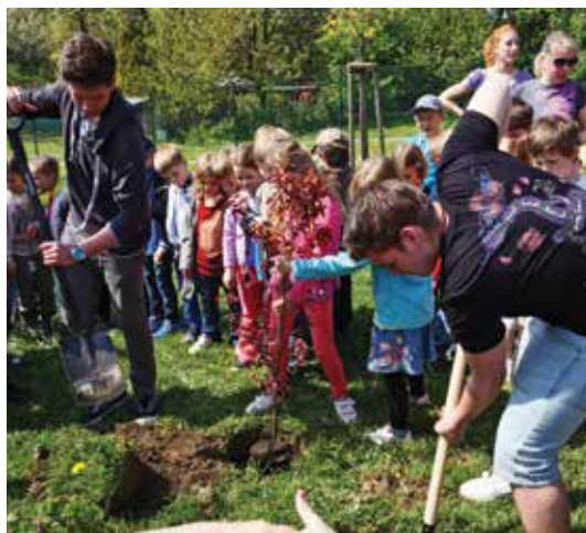
Den Země – sázení stromů na školní zahradě

Kalendář je možné vnímat nejen jako abstraktní systém členění času, ale určitým způsobem i jako rozvrh. Rozvrh dní, týdnů a měsíců, který z podstatné části ovlivňuje život každé školy. A jak vypadal rozvrh jarního období tohoto školního roku U LESA? Všechno zmínit a nezapomenout je nemožné. Tak jen něco málo z toho, co zavonělo jarem.