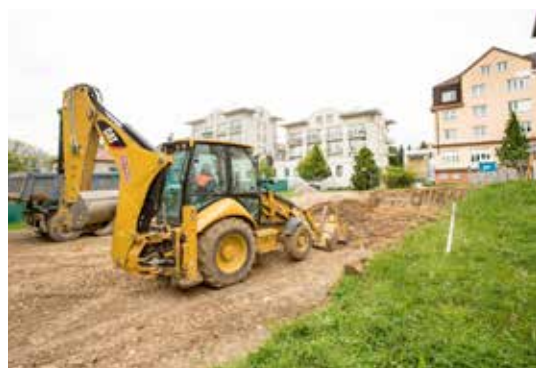
Na Komenského náměstí vedle DPS Senior začala již také výstavba denního stacionáře Olga, která potrvá do konce letošního září.