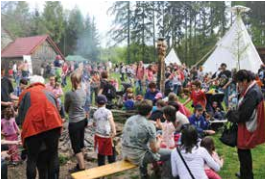
Den Země u Říčanské hájovny