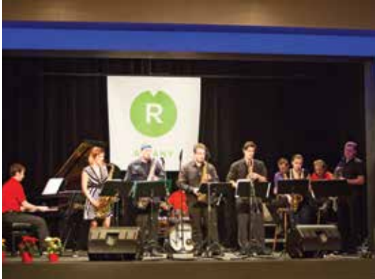
Báječná jazzová kapela SAX & RHYTHM hrála celý večer bez nároku na honorář.