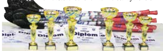
Poháry pro vítěze a sada florbalových holí pro celkového vítěze turnaje

s volnočasovým centrem Na Fialce a za finanční podpory města Říčany první ročník školního florbalového turnaje o Říčanský pohár. Pozvání přijalo 9 florbalových týmů zastupujících 5 škol. Kluci a holky, kteří se sešli v hale Na Fialce, byli rozděleni podle věku do dvou kategorií 6.–7. třída, prima a sekunda a 2. kategorie 8.–9. třída, tercie a kvarta. Takto spolu v kategoriích sehráli zápasy každý s každým, které určily vítěze jednotlivých kategorií. Výsledky se následně sečetly, a tak určily celkového vítěze turnaje. Žáci pro svoji školu vyhráli sadu značkových florbalek UNIHOOC. Na závěr byly vyhodnoceny individuální výkony avš všechny zúčastněné týmy obdržely diplomy, sladkosti, první tři týmy poháry a vítězové navíc poukazy na návštěvu bazénu Na Fialce. Vyvrcholením