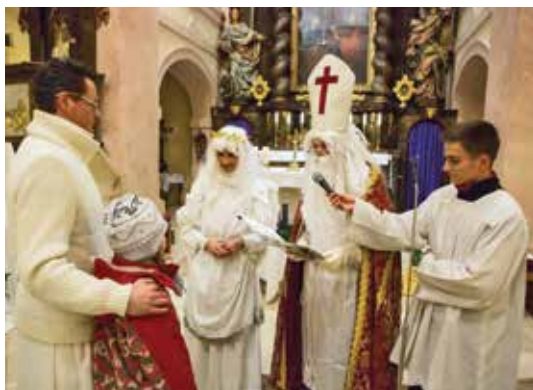
A svatý Mikuláš zavítal také do kostela sv. Petra a Pavla v Říčanech.