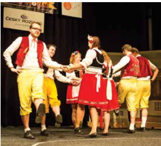
Česká beseda v podání Mládeže z Lensedel