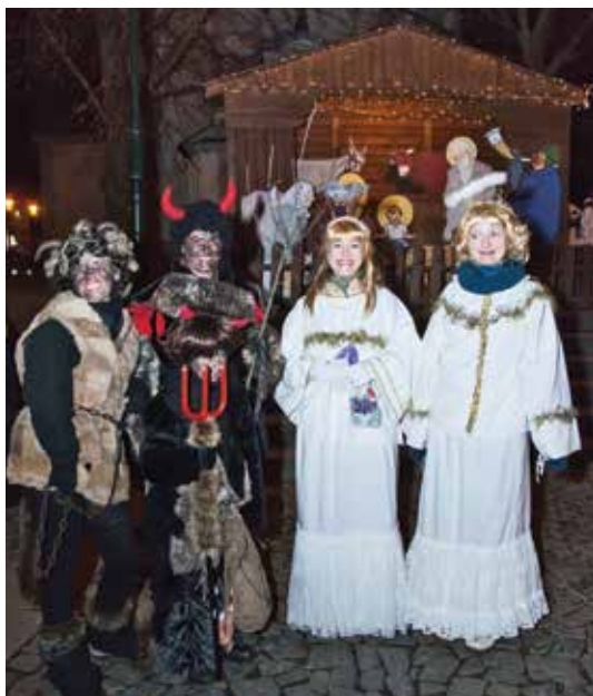
Ve čtvrtek 5. prosince se říčanské náměstí proměnilo v pekelnou říši. Již popáté se zde potkali různorodí čerti, ale i andělé a Mikuláš.