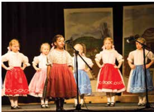
První adventní neděli se konal tradiční koncert U Labutě. V rámci XI. Adventního zpěvování zatančily a zazpívaly děti ze souboru Mikeš ze ZUŠ Říčany.