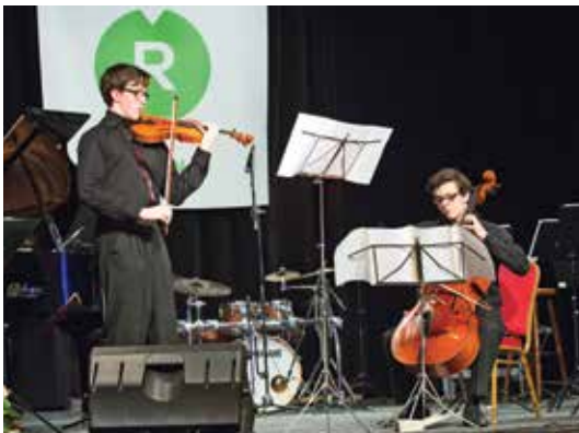
Sourozenci Vlčkovi již tradičně vystoupili zdarma.