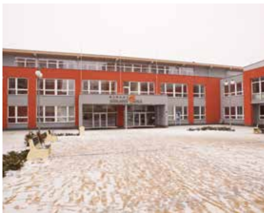
ZŠ u Říčanského lesa

V plánu je rekonstrukce původního bytu školníka v bu-