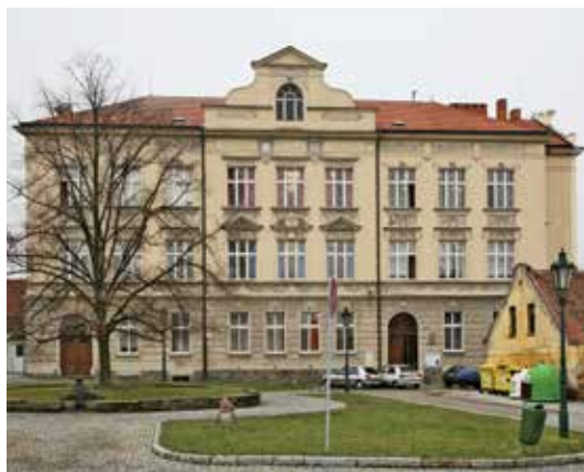
1. ZŠ Říčany