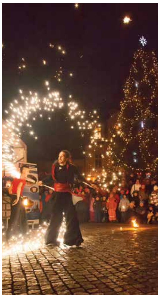
Děti si zde užily bohatý program včetně hodnocení čertovských masek, her a soutěží. V rámci doprovodného programu mohli diváci přihlížet i ojedinelému představení ohňové show.