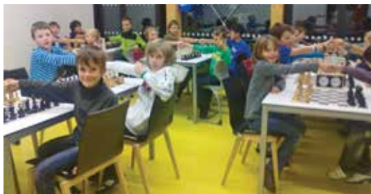
pohled do sálu

Za zmínku stojí druhé místo ZŠ Stříbrné Skalice, která skončila na druhém, postupovém místě na březnové Mistrovství ČR . Za družstvo hráli též kompletně členové našeho klubu.