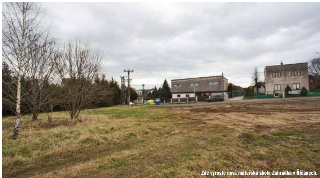
Zde vyroste nová mateřská škola Zahradka v Říčanech.