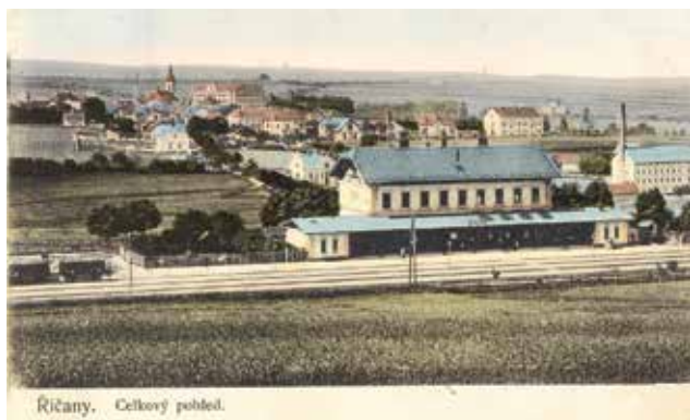
Řičany. Celkový pohled.

Prostorná nádražní čekárna bývala ve válečných letech tak nabitá, že jste se tam od dveří vůbec nevmáčkli. Na vlak se někdy čekalo i hodiny. Pokud nebylo denní světlo, čekali jsme ve tmě, protože se muselo dodržovat nařízené zatemnění. Ani ve vlcích se často nesvítilo. Byly nevytopené, přeplněné, cestující se tísnili na dřevěných lavicích, ale často také v uličkách. Někdy stáli i v mrazu na venkovních plošinách u vagonů, ba i na stupátkách. Dostat se dovnitř do vagonu, kde bylo alespoň zadýcháno, byla určitá výhra. Ve vlcích se smělo kouřit. Snad jen jeden nebo dva vagony byly nekuřácké, ale to se za války moc nedodržovalo. O říčanském nádraží a jeho okolí bude řeč i příště.