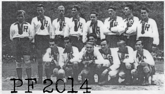
Ragbyové mužstvo Říčan před 1.utkáním na hřišti v Radešovicích v roce 1944.

SEDMDESÁT LET RUGBY CLUB ŘÍČANY 1944–2014