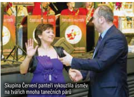
Skupina Červení panteré vykouzila úsměv na tvářích mnoha tanečních párů