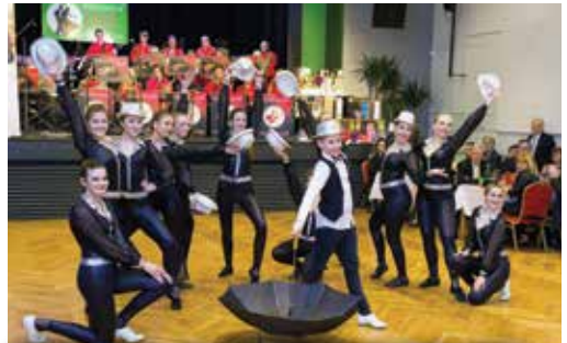
O předtančení se postaraly různé taneční skupiny, které ve městě působí. Kromě Dance EB (na snímku) také TS Twist nebo Kiou Fuego