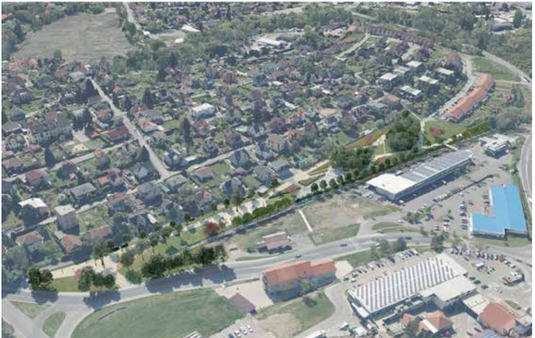
Vizualizace parku, která ještě doznala úprav