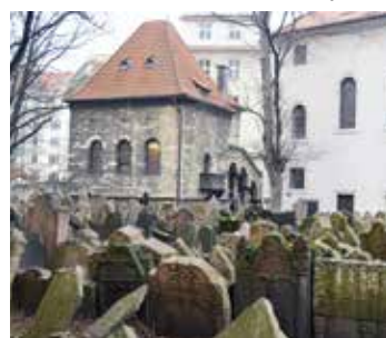
Starý židovský hřbitov