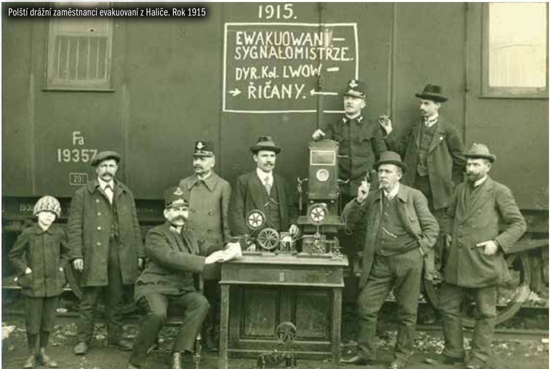
Poštití drážní zaměstnanci evakuovaní z Haliče. Rok 1915

schůzi té probrán rozpočet na rok 1918 a vzaty na vědomí účty za rok 1917.