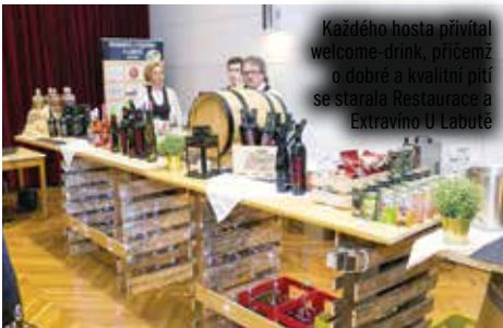
Každého hosta přivítal welcome-drink, přičemž o dobré a kvalitní pití se starala Restaurace a Extravino U Labutě