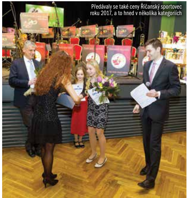
Předávaly se také ceny Říčanský sportovec roku 2017, a to hned v několika kategoriích