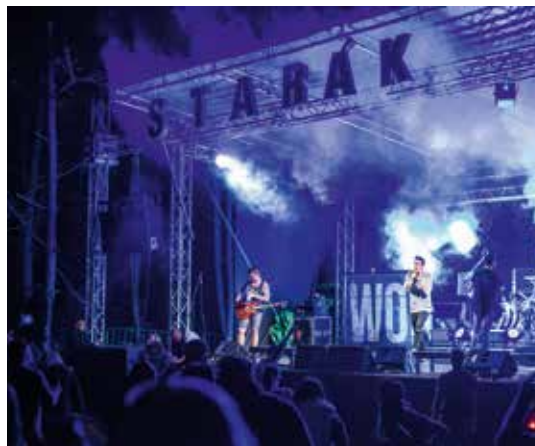
Ilustrační snímky z předchozích ročníků Staráku