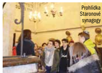
Prohlídka Staronové synagogy