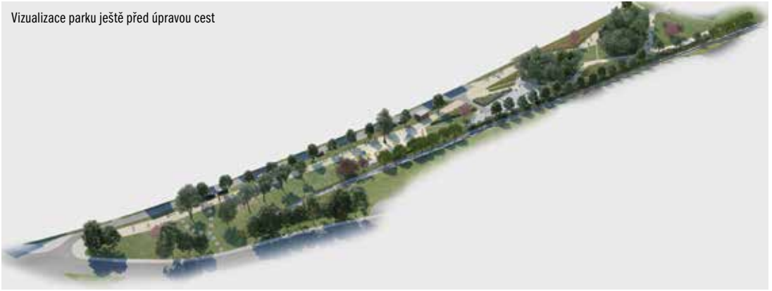
Vizualizace parku ještě před úpravou cest

květin vysetých podél potoku se stane lákadlem pro motýly. Park vhodně doplní i mobiliář jako lavičky, stojany na kola, piknikové sestavy, parková lehátka, ohniště, koše (i pro pejskaře), pítka, ptačí budky a hmyzí domečky. Parkové cesty a zpevněné plochy mají navrženou mlatovou úpravu. Pro zimní radovánky půjde využít v západní části svah pro sánky či boby. V parku nebudou chybět ani veřejné toalety a lampy veřejného osvětlení.