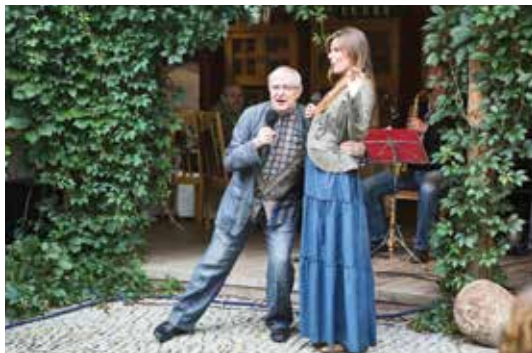
Do Čajovny zavítal legendární umělec a hlavní postava Divadla Semafor Jiří Suchý.