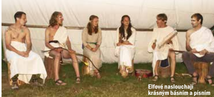
Elfové naslouchají krásným básním a písním

Tím sice tábor skončil, ale my se scházíme i během roku a rádi uvítáme další nováčky. Schůzky začínají každý pátek v 15.45 v parčíku u nemocnice. Kdo přijde, může s námi hrát hry v lese i na hřišti, poznat nové kamarády a naučit se spoustu užitečných věcí pro život (nejen) v přírodě.