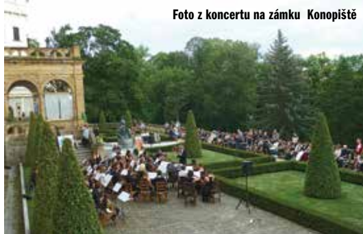
Foto z koncertu na zámku Konopiště