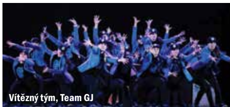
Vítězný tým, Team GJ