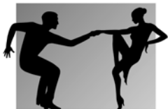
TŠ Twist Říčany

V poslední době jsme psali zejména o nejúspěšnějších reprezentantech ČR – mistryních světa z formací Madonna a Tequilas a také o mistrovských párech formace Fascination. Ve Twistu však máme i další skupiny, vybere si opravdu každý. Ať dívka, či chlapec, mladší, či starší, rekreační tanečník, či zarputilec. Sdružujeme jak mistry, tak „rekreačnější“ tanečnický, a to ve všech věkových kategoriích. Vždyť naši odchovanci z přípravy už studují vysoké školy!