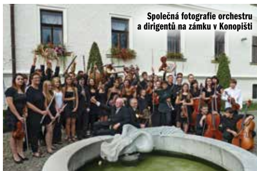
Společná fotografie orchestru a dirigentů na zámku v Konopišti

V sobotu ráno proběhlo velmi emotivní loučení, myslím, že v nejednom oku se zaleskla slza.