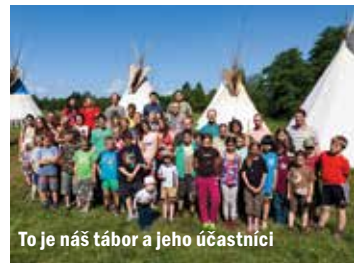
To je náš tábor a jeho účastníci

Na závěrečném sněmu se tři účastníci stali členy kmene. Rody, vedené letos novými náčelníky, si rozdělily výborné dorty jako odměnu za skvělé výkony během všech táborových činností. A každý účastník dostal na památku Bilbův kouzelný prsten.