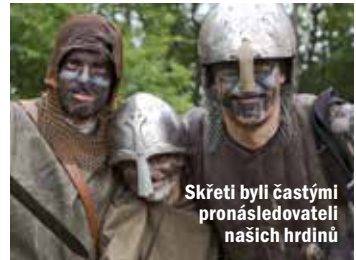
Skřeti byli častými pronásledovateli našich hrdinů