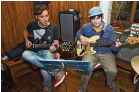
Jazzové sdružení MDDH zahrálo publiku v restauraci U Anežky.