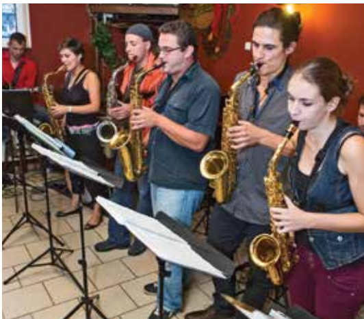
Návštěvníkům restaurace Na Rychtě hudebně zpříjemnilo večer známé říčanské seskupení Sax & Rhythm.