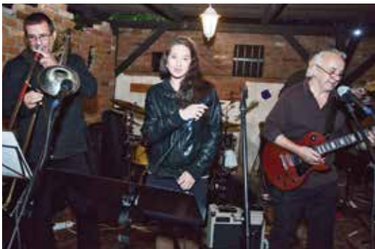
V restauraci u Kozlů se v pondělí představila kapela Jazzmazec.

Poslední srpnový týden patřil tradičně jazzovému a swingovému festivalu Pohoda Džez 2013, který se konal v Říčanech již potřetí. V minulém čísle jsme přinesli pohled na atmosféru prvních koncertů. Jaké kapely se na festivalu představily v další dny?