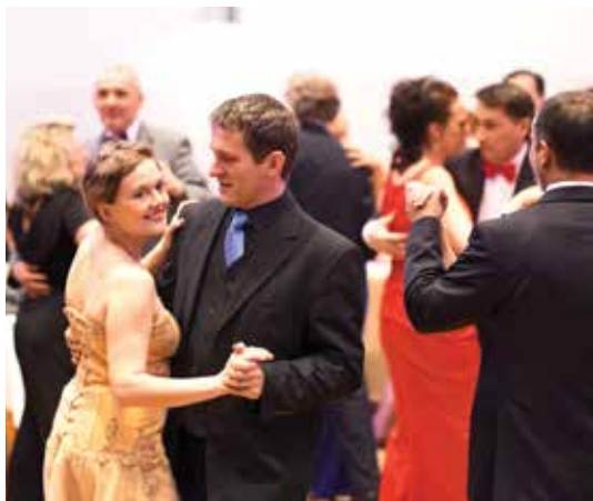
Parket byl již od počátku plný nadšených tanečníků