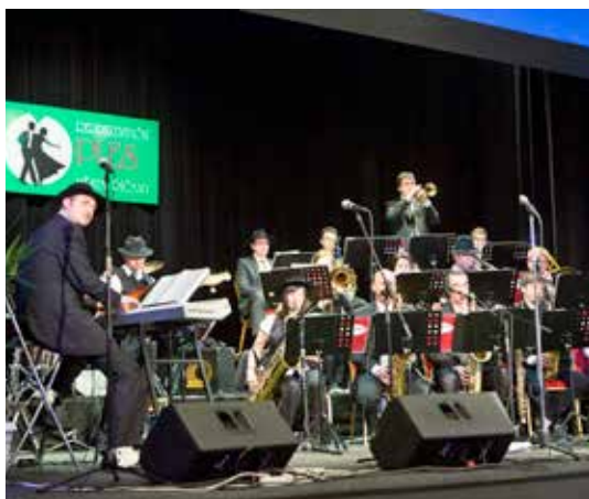
Hudební skupina Magnum Jazz Bigband vytvořila příjemnou atmosféru celého večera