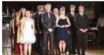
Předtančení studentů 1. A.