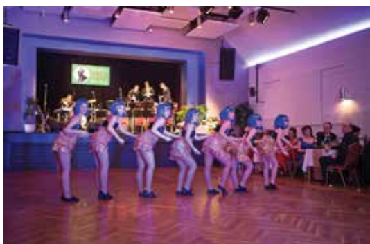
Dívky z taneční skupiny DANCE EB předvedly divákům několik sestav z jejich bohatého repertoáru