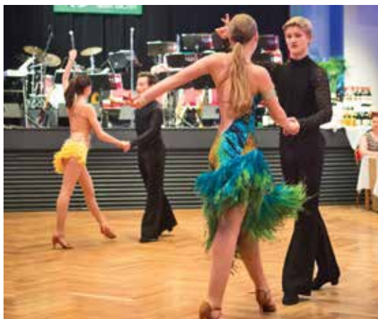
Dva taneční páry z TK Fuego se rozhýbaly do rytmu latinskoamerických tanců