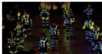
Světelný efekt tančících studentů 4. A.