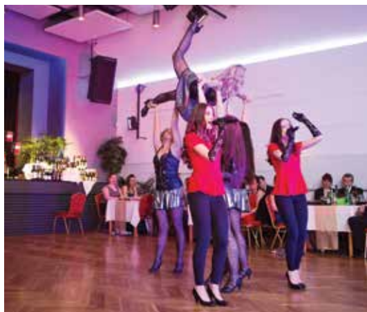
Společné muzikálové vystoupení tanečnic TS DANCE EB a zpěvaček z Eillas