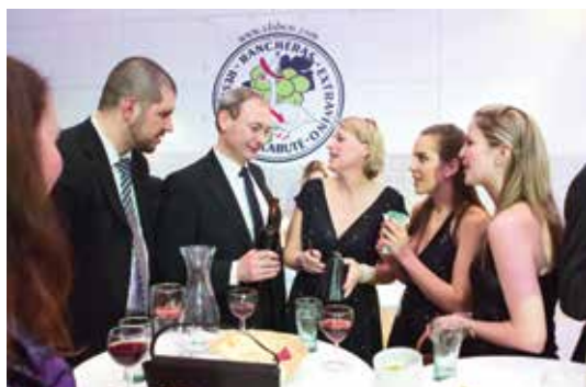
Vinný bar přímo na parketu byl skvělý nápad vinotéky EXTRAVÍNO U LABUTĚ