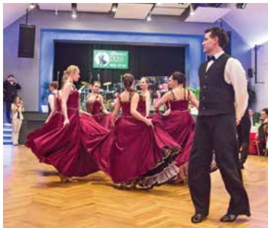
Vídeňský valčík v podání říčanského tanečního klubu Fuego