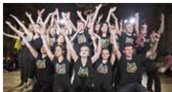
Předtančení oktávy se neslo v duchu oblíbených seriálů.