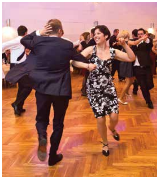
Do hraní se pustila zvesela a energicky a roztančila tak mnoho (nejen moravských) párů