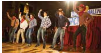
4. A své předtančení pojala jako taneční soutěž Yolo Faktor.