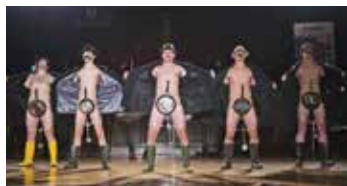
Půlnoční překvapení oktávy.