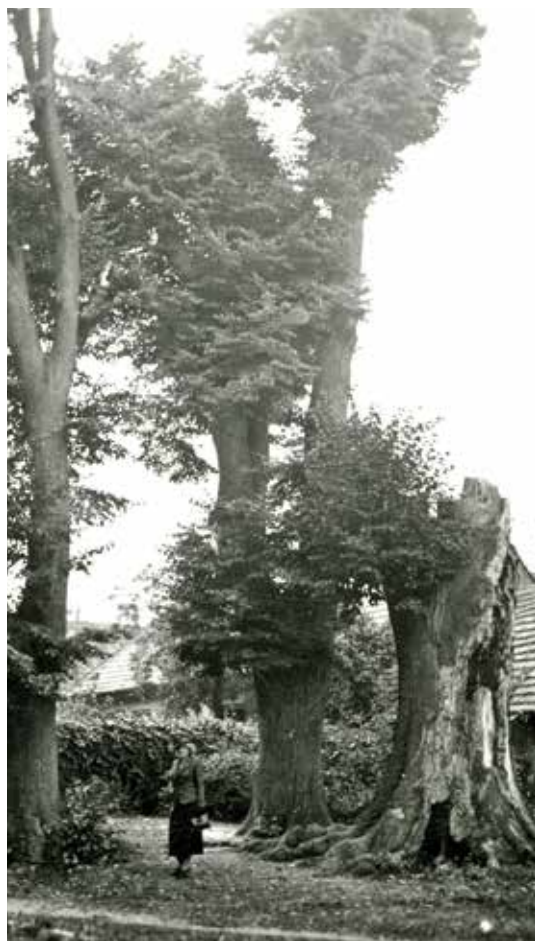
Dámu pod staletými lipami zachytil fotoaparát kolem roku 1940.